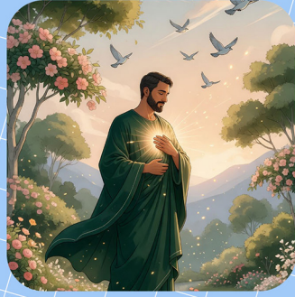
ویژگی های دولت کریمه